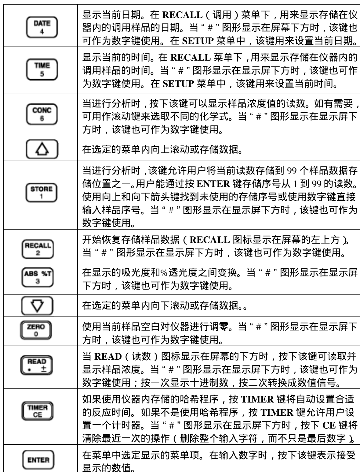
表 1 按键及描述 (继续)