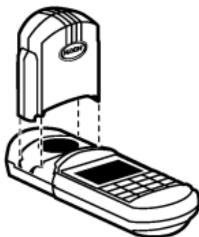
图 8 安装遮光器

为了在测试实验时使用仪器罩作为遮光器,应将仪器罩放在样品池上,并插入仪器上的凹槽。