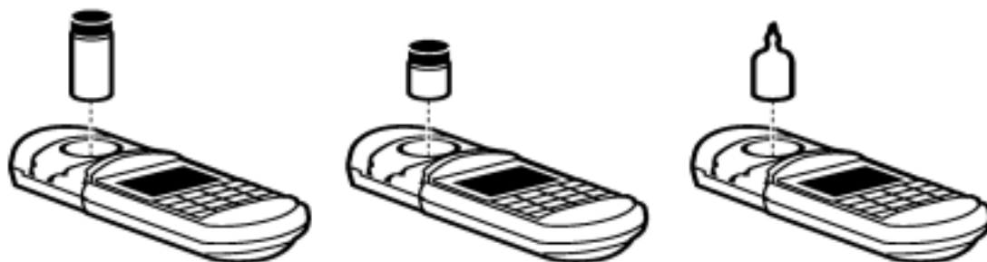
图 5 将样品放入样品池盒中

用不起毛的布或纸巾擦拭样品池,然后将样品池插入样品池盒中,并使菱形标记朝着键盘。